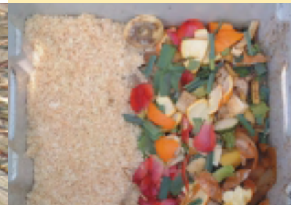
Rechts: vers aangevoerd verkleind keukenafval. Links: werd het afgedekt met een laagje houkrullen. Dat laatste kan nuttig zijn wanneer er een probleem optreedt van vocht of fruitvliegjes.