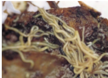
Dit zijn geen jonge compostwormen maar enchytraeën of potwormen. Hun aanwezigheid duidt op een te vochtige omgeving. Het zijn fijne witte wormen van 2 à 3 cm lang met een lange scherpe punt aan kop en staart. Soms zijn ze massaal aanwezig. Ze hebben geen negatief effect, maar zijn een signaal om het vochniveau in de gaten te houden.