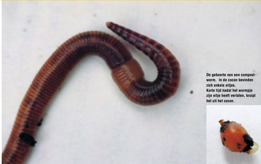
De geboorte van een compost-worm. In de cocon bevinden zich enkele eitjes. Korte tijd nadat het wormpje zijn eitje heeft verlaten, kruipt het uit het cocon.

Regenwormen zijn ongewervelde dieren die behoren tot de groep van de ringwormen. Hun lichaam bestaat uit tientallen segmenten en ringen. Elke ring is bezet met vier paar haren of borstels. Daarmee klemmen ze zich ter hoogte van enkele ringen vast in de grond of tussen de bladeren terwijl zij de rest van hun lichaam vooruitstrekken. Vooraan, op ongeveer een derde van het lichaam, bevindt zich bij volwassen wormen een verdikking: het zadel.