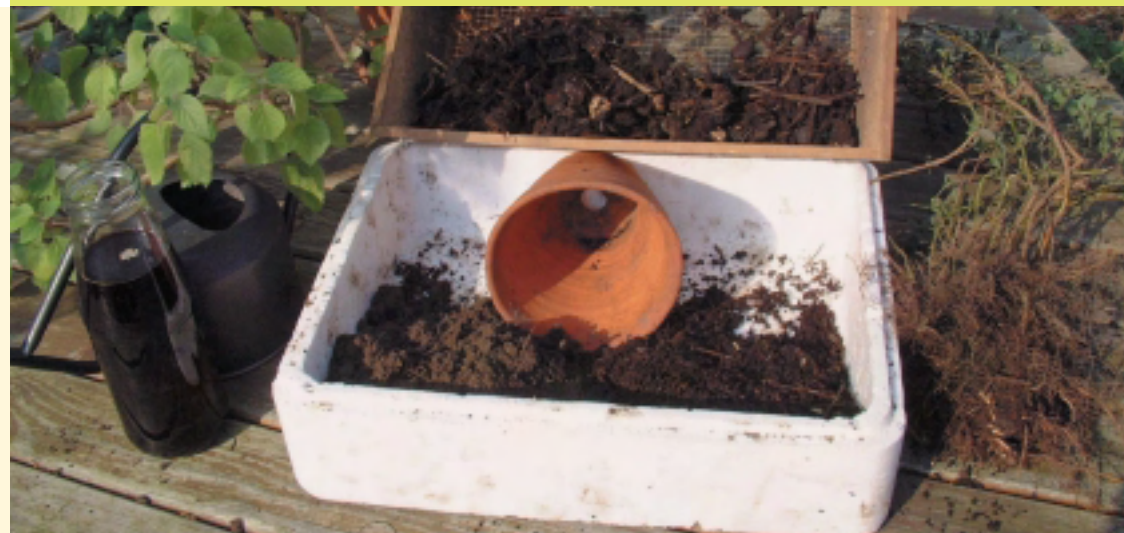
Wormencompost laat je toe om potgrond te 'reanimeren'. Onderaan de pot kan je een laagje zeefoverschot aanbrengen voor een goede afwatering.

post als bestanddeel voor potgrond dan zullen jonge wormpjes later terug te vinden zijn in de potkluit. Dit is geen probleem. Ze verrichten geen schade aan de plantenwortels en zolang de potkluit vochtig blijft, kruipen ze er niet uit.