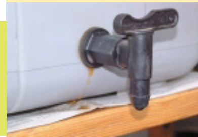
Dit kraantje werd niet lekdicht gemonteerd. Eens de bak in gebruik is het zo goed als onmogelijk om hieraan nog te verhelpen. Een gewaarschuwd wormenbakgebruiker...